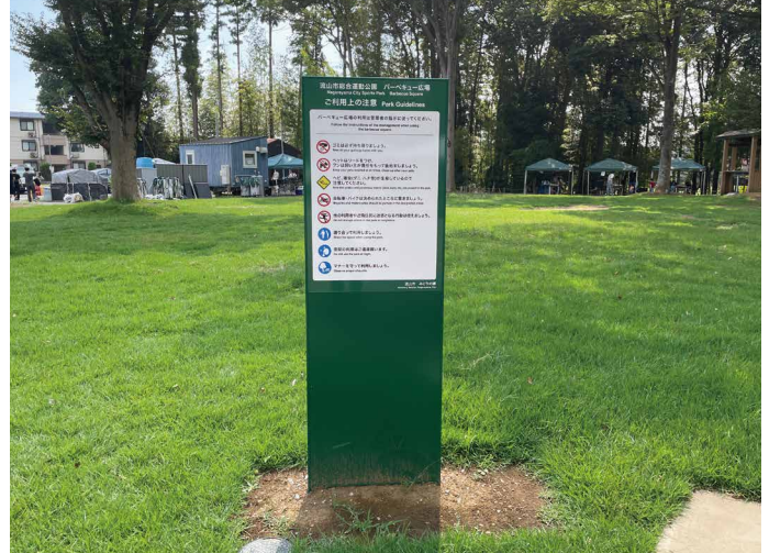
表示板：W590xH890 表示方法：スーパーカラー BR110 印刷 本体素材：アルミ押出形材