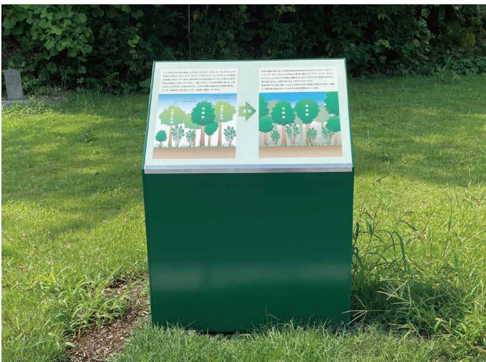
表示板サイズ：W890xH590 表示方法：スーパーカラー BR110 印刷 本体素材：アルミ押出形材