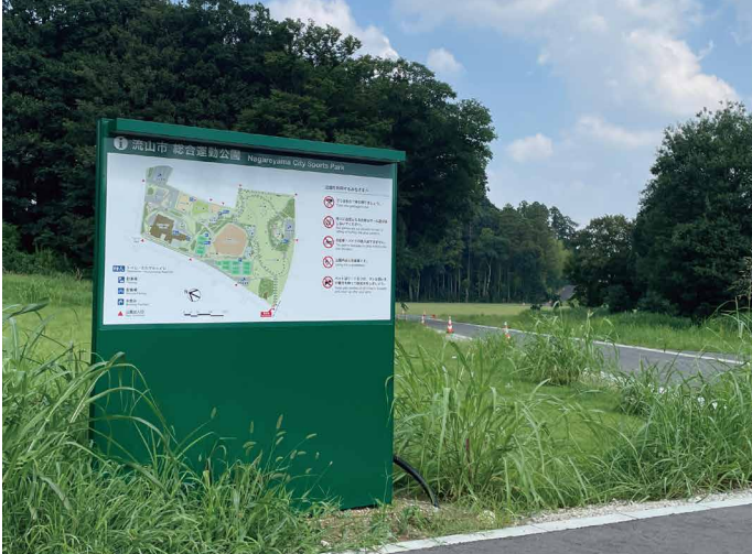
表示板サイズ：W1490xH890 表示方法：スーパーカラー BR110 印刷 本体素材：アルミ押出形材