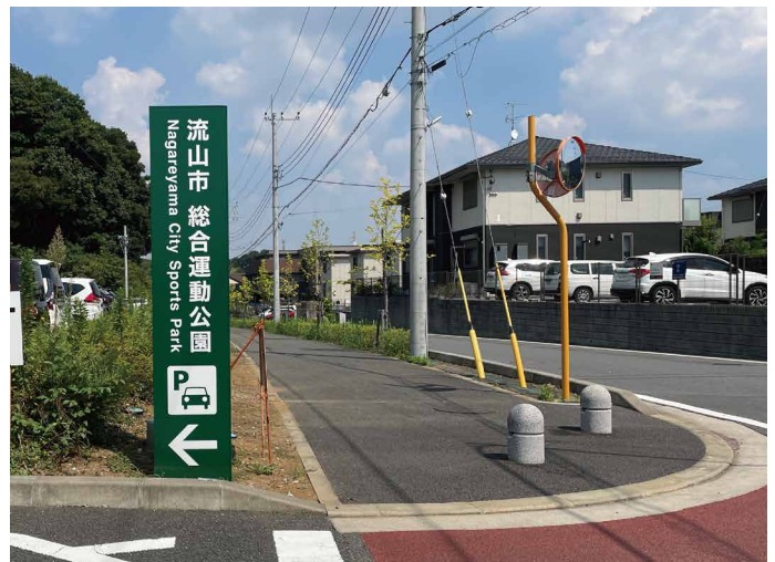
表示板サイズ：W490xH2495 表示方法：カッティングシート 本体素材：アルミ押出形材