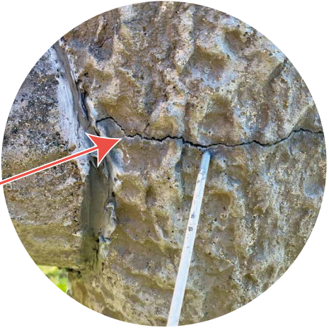
各サインの仕様を確認し、 規準点検・劣化点検をおこないます。