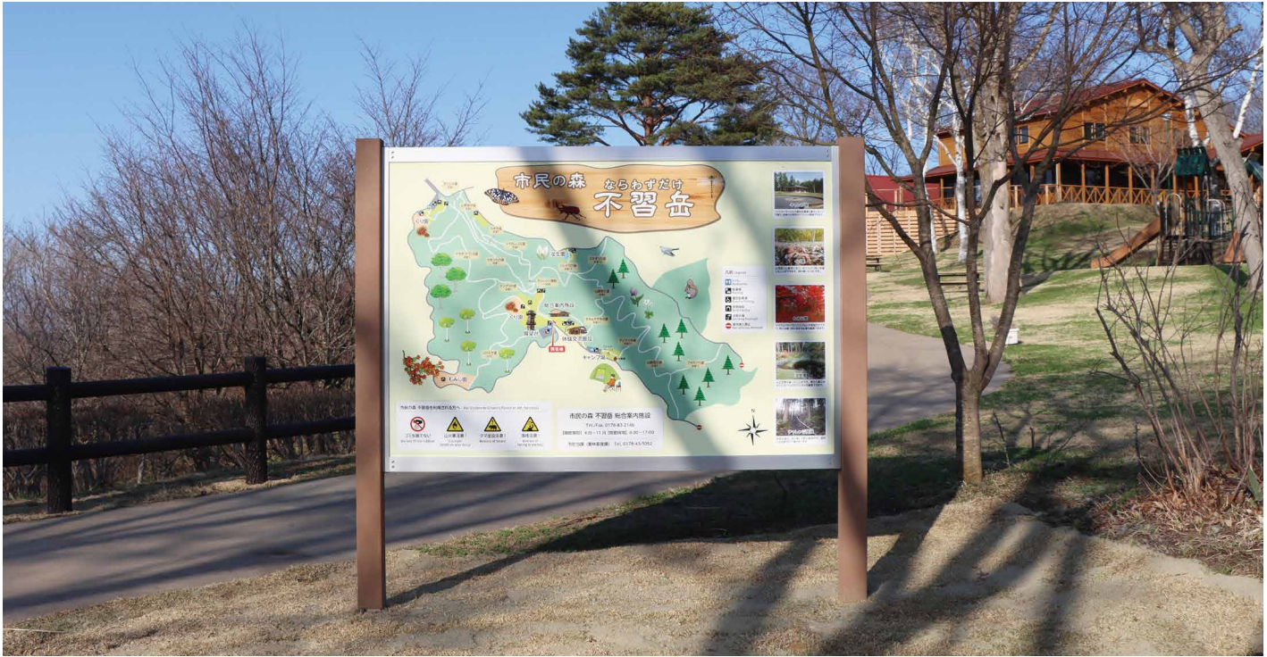
表示板サイズ：W1782xH1182 表示方法：スーパーカラー R印刷 本体素材：アルミ押出形材+リサイクルウッド