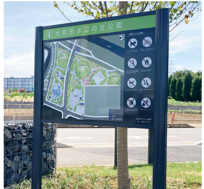
表示板サイズ：W1170xH880 表示方法：スーパーカラー BR110 印刷 本体素材：アルミ押出型材