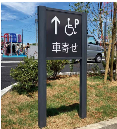
表示板サイズ：W570xH580 表示方法：スーパーカラー BR110 印刷 本体素材：アルミ押出型材