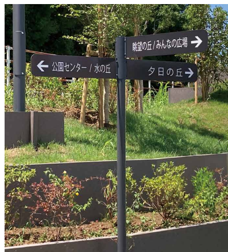
表示板サイズ：W800xH180 表示方法：スーパーカラー BR110 印刷 本体素材：ステンレス