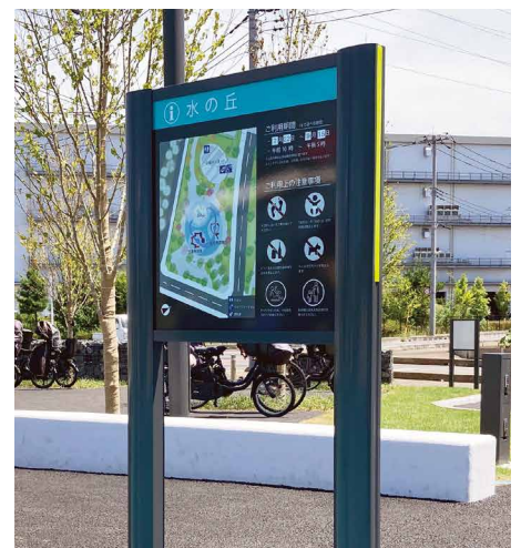
表示板サイズ：W570xH580 表示方法：スーパーカラー BR110 印刷 本体素材：アルミ押出型材