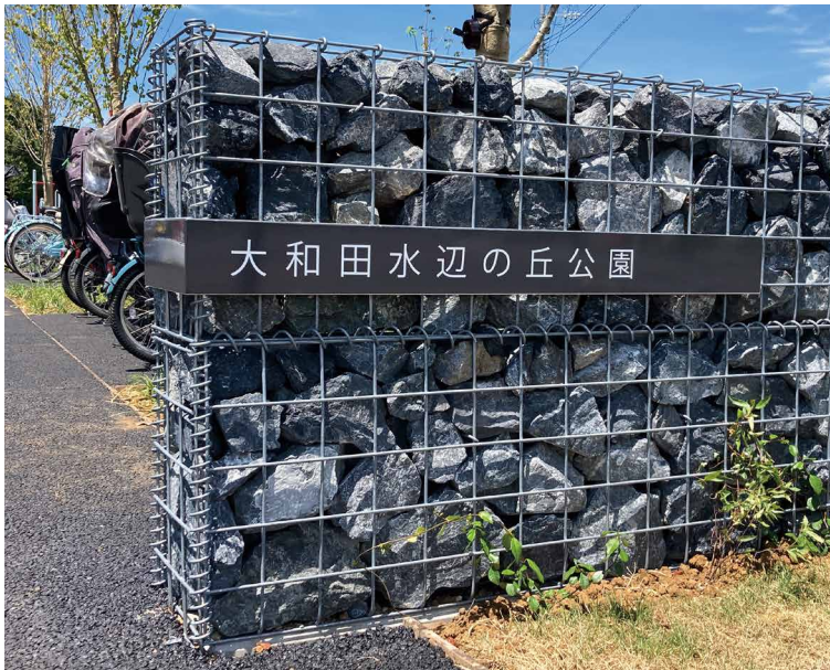
表示板サイズ：W1199xH299 表示方法：スーパーカラー BR110 印刷