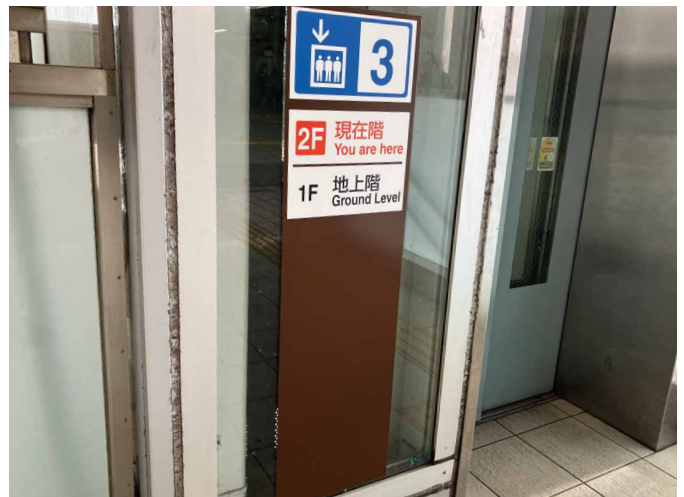
表示板サイズ：W300xH1080 表示方法：スーパーカラー R 印刷