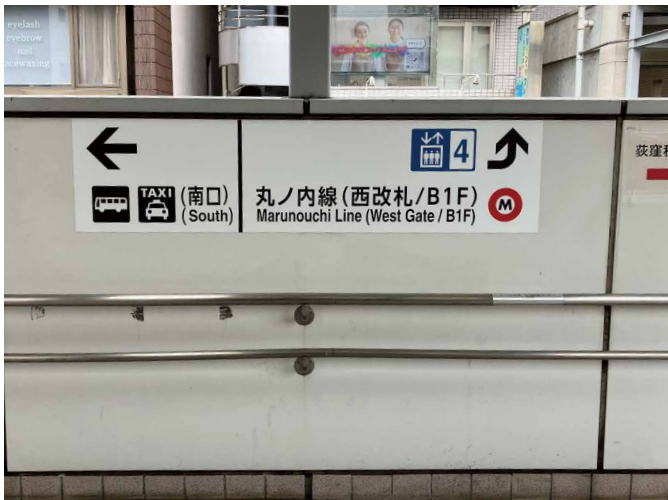
表示板サイズ：W1650xH400 表示方法：スーパーカラー R 印刷