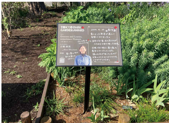
表示板サイズ：W414xH291 表示方法：スーパーカラー R印刷 本体素材：アルミ押出形材