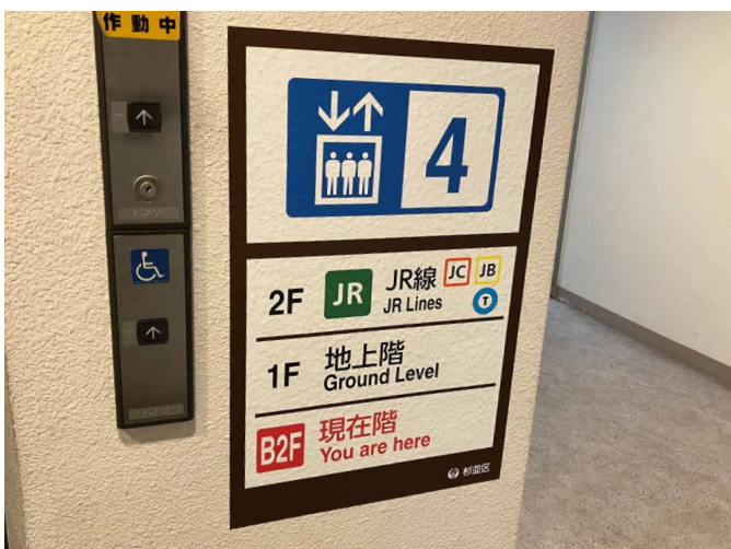
表示板サイズ：W420xH635 表示方法：3M™ スコッチカル™ ペイントフィルム