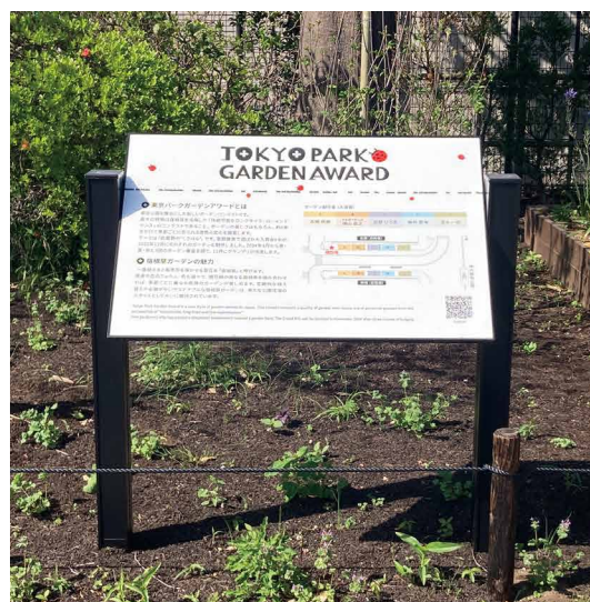
表示板サイズ：W894xH594 表示方法：スーパーカラー R印刷 本体素材：アルミ押出形材