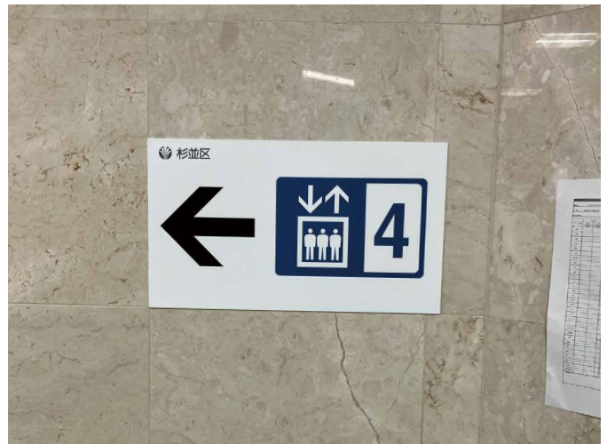
表示板サイズ：W650xH300 表示方法：スーパーカラー R 印刷