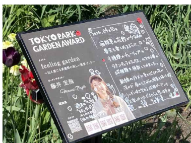
受賞者による手書きコメント (定期的に更新されています)