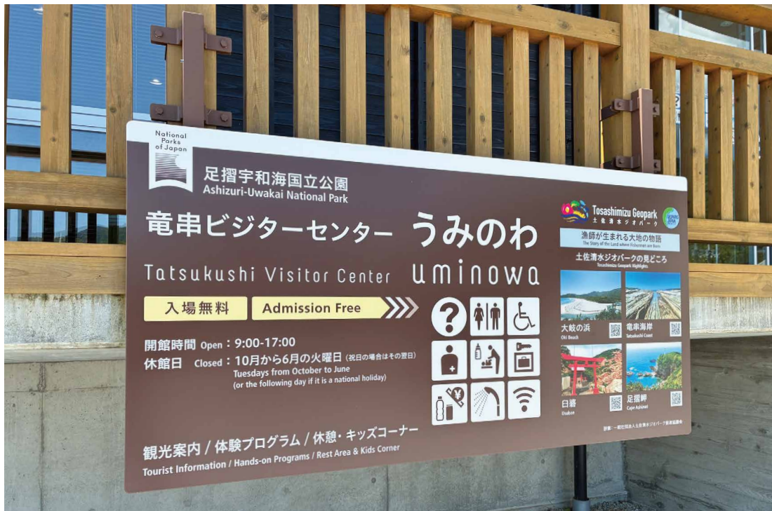
表示板サイズ：W1800xH900 表示方法：スーパーカラー EX 印刷