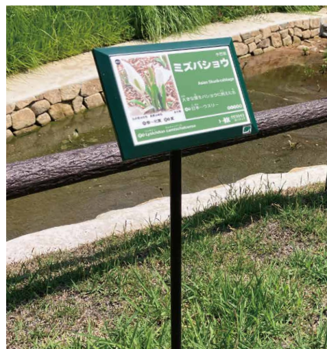
表示板サイズ：W143xH93 表示方法：スーパーカラー R 印刷 設置方法：スチールポール