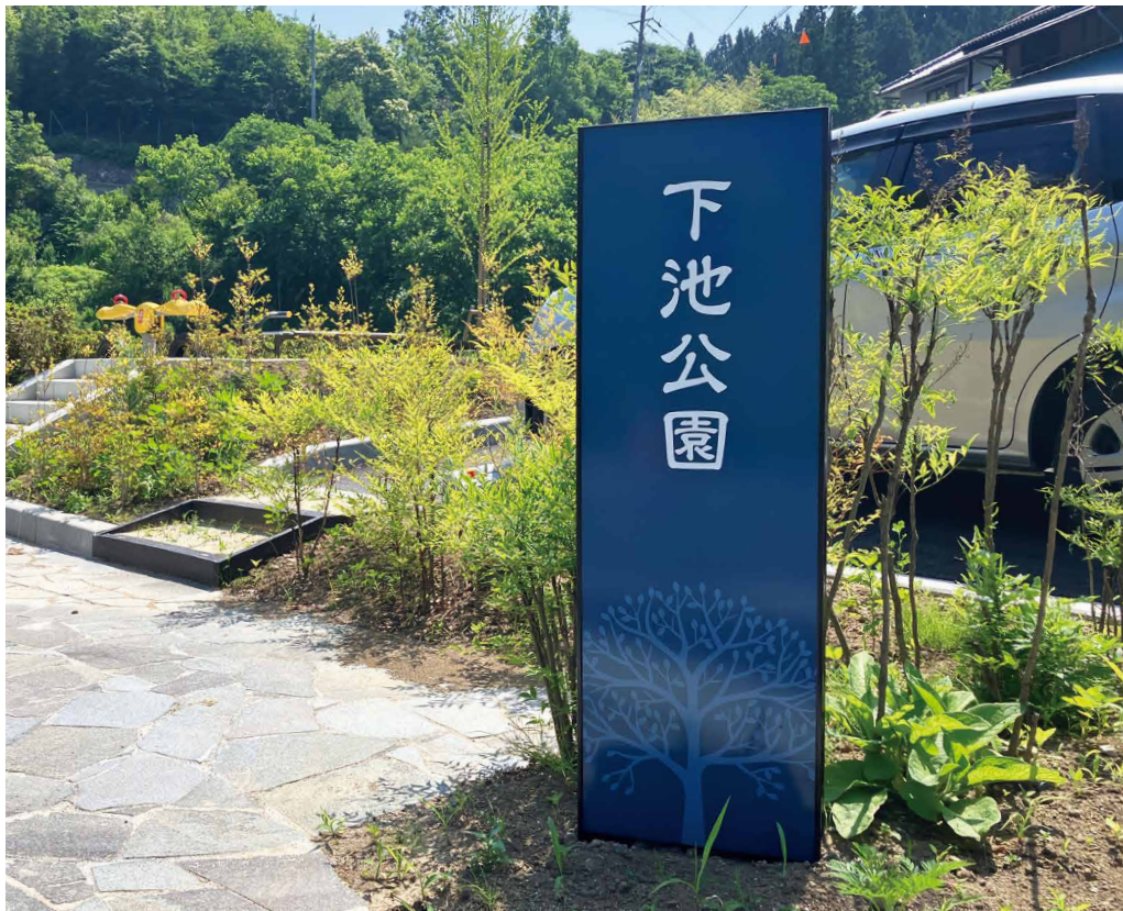
表示板サイズ：W380xH1195 表示方法：スーパーカラー BR60 印刷 本体素材：アルミ押出形材