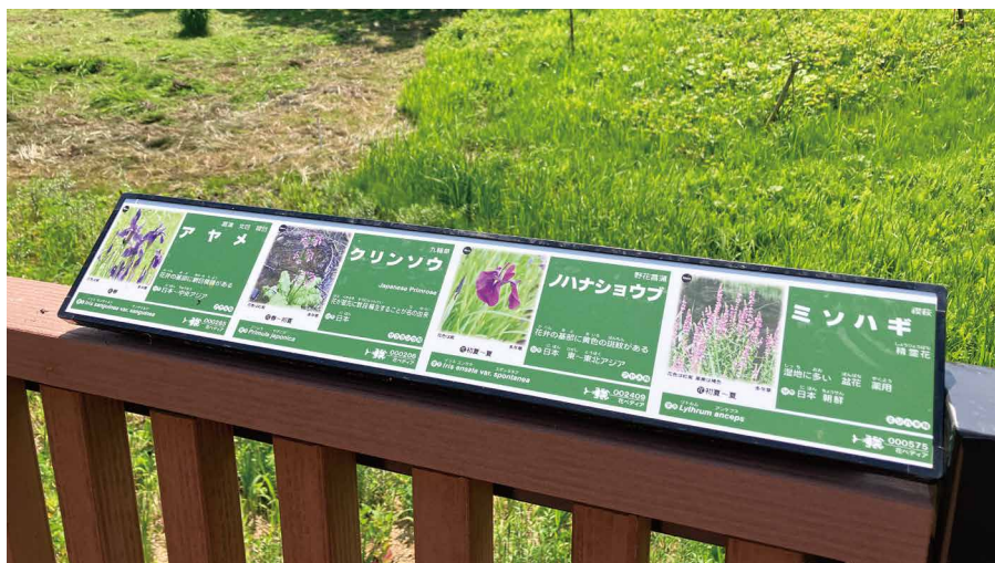
表示板サイズ：W674xH114 表示方法：スーパーカラー R 印刷