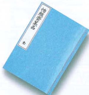
『怡顔齋菓品』松岡玄達編著。宝暦8年稿成る。未刊。昭和10年岩瀬文庫本の写本。1冊