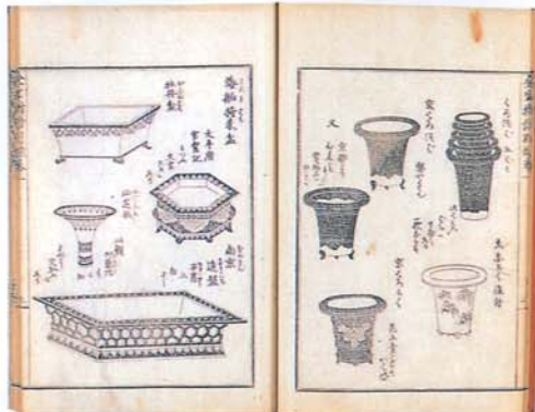
上巻見開き。盆の色々（阿蘭陀産もあり）