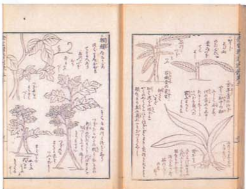
下巻見開き。草ものの接ぎ木図

「金生樹譜」かねのなるきのふ、とも読む。江戸後期の園芸書。上巻には盆栽について図説されている。すなわち、鉢栽培の盆は人の衣服のごとく、書画の表装のごとし。植えられた植物との調和が大切であり、出来不出来にも通じると盆の大切さを示し、さらに観賞するうえで敷板、台、棹、棚の種類と選び方、遠地への運搬用の箱も図示されている。 栽培法では屋外の栽培棚、冬越しの室内用の唐壺、屋外での大がかりな岡室の造り方、取り扱い上の注意、暖房の方法を述べ、外来植物など暖地性植物の冬越し、鉢花、草花、切枝物の促成など当時の進んだ技術が紹介されている。 中巻は松、柳、梅の各地の銘木の図説、下巻は接ぎ木、取り木、挿し木、実生、培養土、園芸用諸道具を図解。園芸書として今日的編集と同様であるが、上巻末尾に面白いことが記されているので紹介する。 「凡物を愛すると好とは同じことのやうなれど少し違ふなり。愛はなほだしくしては必ず偏になり、好盛にしては必ず妙に至る。其故いかにと云ふ愛する人はただその花葉の美を喜ぶのみにして其花木の性を考へ、その養ふ志をつくすに及ばず（中略）好人のころはずつと替たもの、まづ第一に草木の性をよく考へ山にあるもの野にあるもの各々その土こしらへに心をつくし、又暖国と寒国との氣候を丁寧（けんぜん）に懸断し南海の草を東海の暖室に養ひ彼をして東海たることを忘れ本国のまゝに繁昌さするは、さりとては好の妙神に通ずと云ふべし、これ近ごろ餘計の冗言ながら筆の序にしるす」（内著者補）