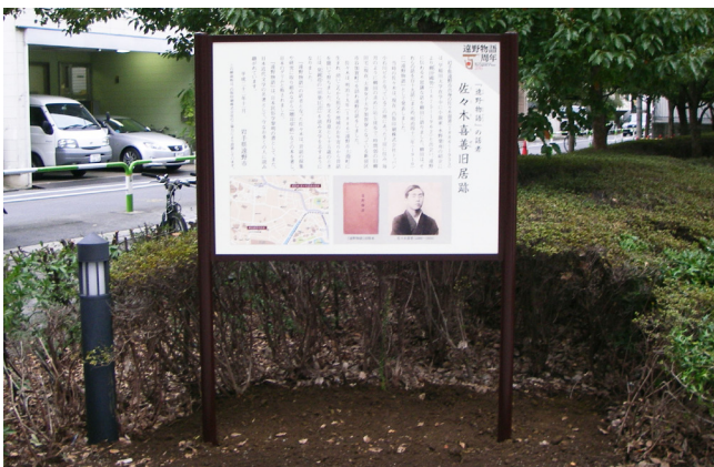
表示板サイズ：W1182 × H880 表示方法：ハイブリットカラー 本体素材：アルミ押出形材