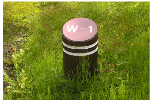
表示板サイズ：W240 × H250（楕円） 表示方法：ハイブリットカラー 本体素材：青森県産杉材（燻製加工処理）