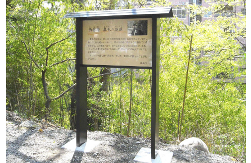
表示板サイズ:W900×H600 表示方法:ハイパーカラー 本体素材:ステンレス(焼付塗装仕上)