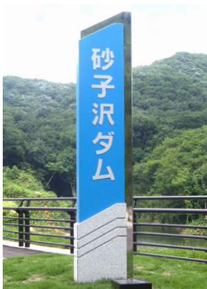
表示板サイズ:W600×H3150 表示方法:ステンレス切文字 本体素材:白御影石、ステンレス