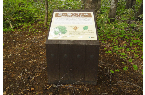
表示板サイズ：W600 × H600 表示方法：ハイブリットカラー 本体素材：青森県産杉材（燻製加工処理）