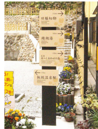
表示板サイズ:W350×H225 表示方法:ハイパーカラー 本体素材:ステンレス(焼付塗装仕上)