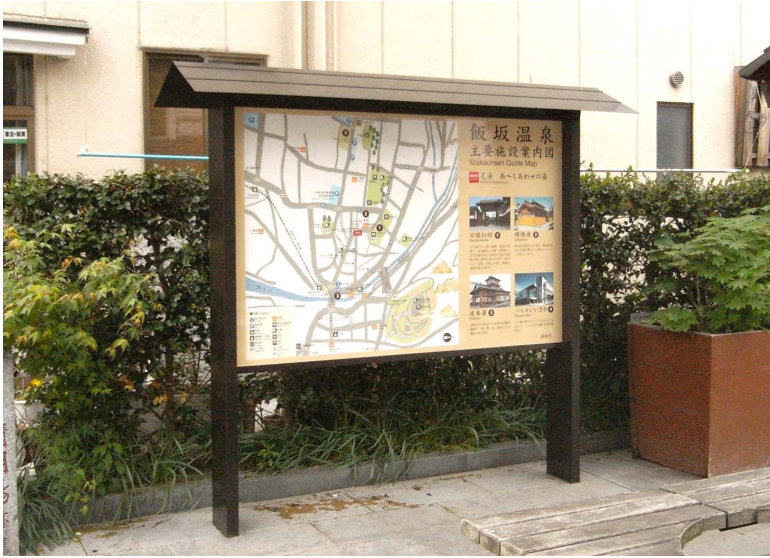
表示板サイズ:W1640×H1100 表示方法:ハイパーカラー 本体素材:ステンレス(焼付塗装仕上)