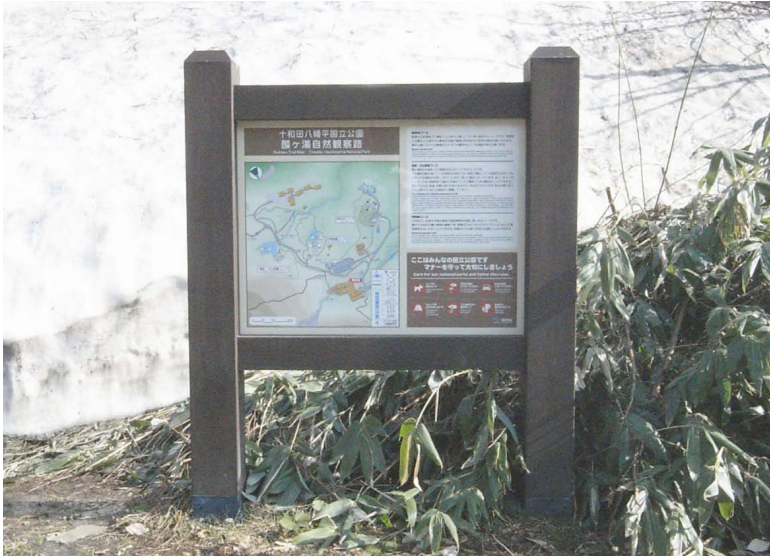
表示板サイズ：W1200 × H900 表示方法：ハイブリットカラー 本体素材：青森県産杉材（燻製加工処理）