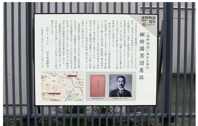
表示板サイズ：W1200 × H900 表示方法：ハイブリットカラー 本体素材：アルミ