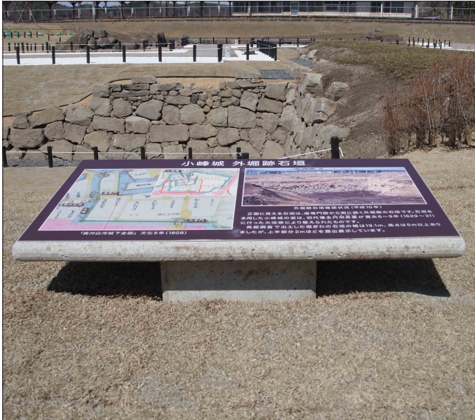
表示板サイズ：W1470×H720mm 表示方法：油性インクジェット印刷＋熱硬化型フッ素系トップコート