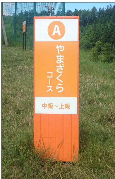
表示板サイズ：W188×H500mm 表示方法：スーパーカラー R + ABX コート 本体素材：再生樹脂（カラーラブロック）