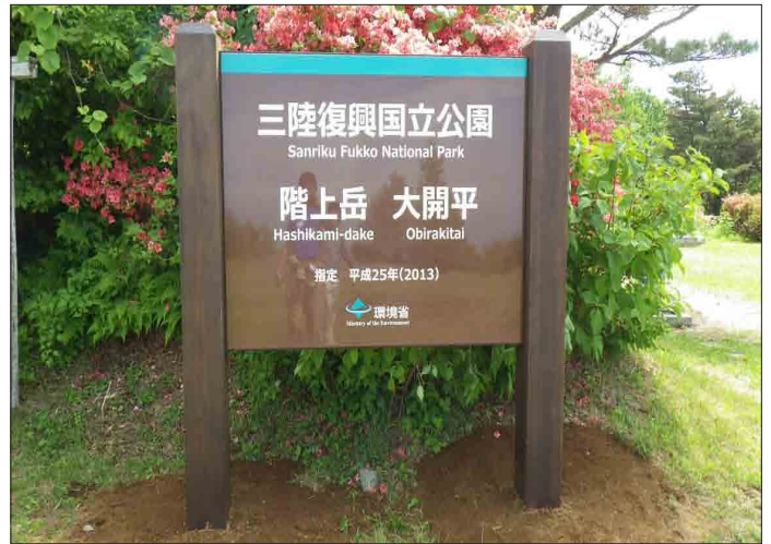
表示板サイズ：W1500×H1200mm 表示方法：ハイブリッドカラー 本体素材：杉材（防腐剤加圧注入処理）