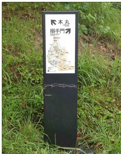
表示板サイズ：W240×H400mm 表示方法：ハイブリッドカラー 本体素材：SUS（焼付塗装）