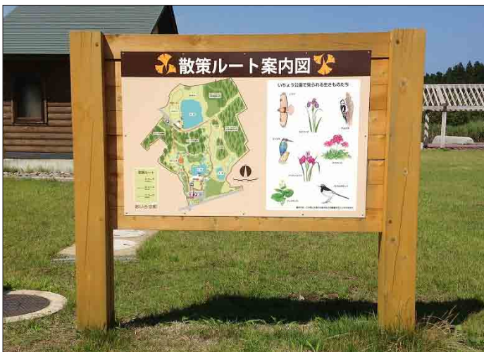
表示板サイズ：W1500×H1000mm 表示方法：スーパーカラー R 本体素材：ヒバ材（防腐剤加圧注入処理）