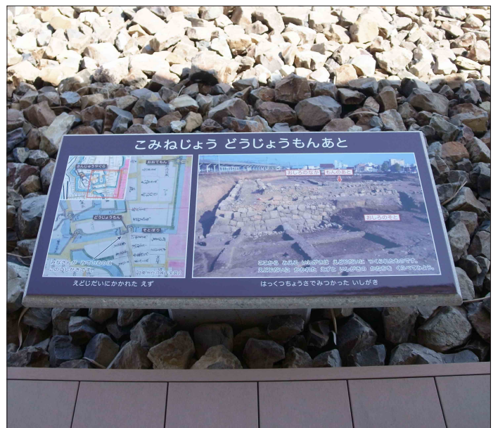
表示板サイズ：W1500×H800mm 表示方法：油性インクジェット印刷＋熱硬化型フッ素系トップコート