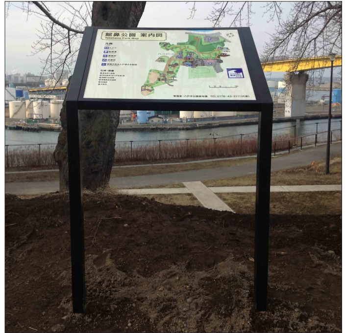
表示板サイズ：W860×H560mm 表示方法：油性インクジェット印刷＋熱硬化型フッ素系トップコート 本体素材：SUS（焼付塗装）