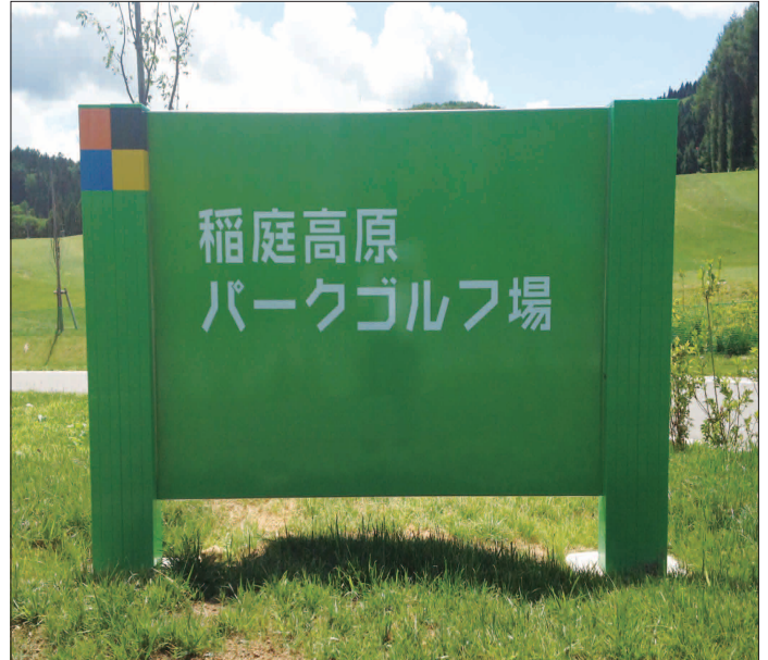
表示板サイズ：W1500×H800mm 表示方法：スーパーカラー R + ABX コート 本体素材：再生樹脂（カラーラブロック）