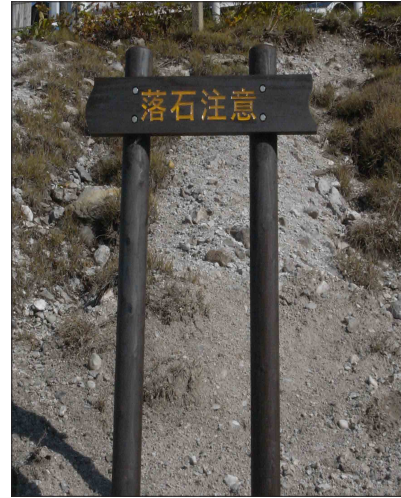
表示板サイズ：W1000×H200mm 表示方法：彫込墨入 本体素材：杉材（防腐剤加圧注入処理）