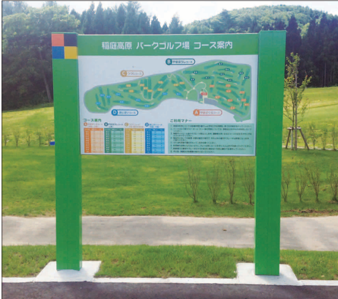
表示板サイズ：W1500×H1000mm 表示方法：スーパーカラー R + ABX コート 本体素材：再生樹脂（カラーラブロック）