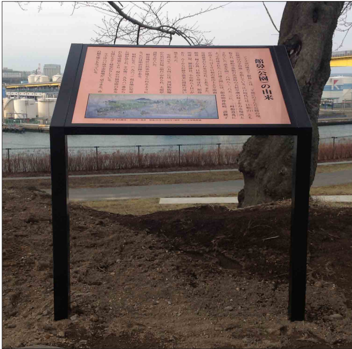
表示板サイズ：W860×H560mm 表示方法：銅版エッチング 本体素材：SUS（焼付塗装）