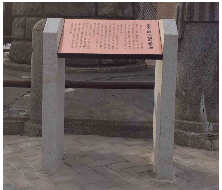
表示板サイズ：W600×H400mm 表示方法：銅版エッチング 本体素材：錆御影石＋SUS（焼付塗装）