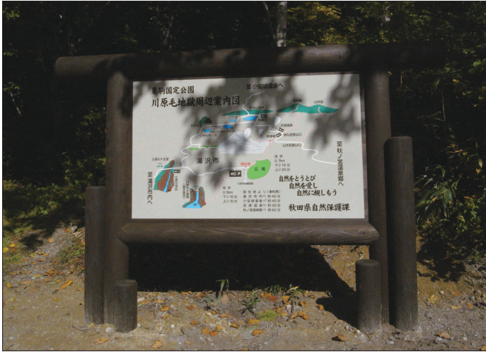
表示板サイズ：W2120×H1300mm 表示方法：ハイブリッドカラー 本体素材：杉材（防腐剤加圧注入処理）