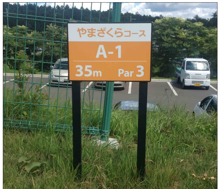
表示板サイズ：W300×H210mm 表示方法：スーパーカラー R + ABX コート 本体素材：再生樹脂（カラーラブロック）