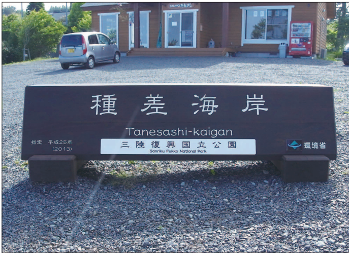
表示板サイズ：W2500×H700mm 表示方法：彫込墨入+ハイブリッドカラー 本体素材：杉材（防腐剤加圧注入処理）