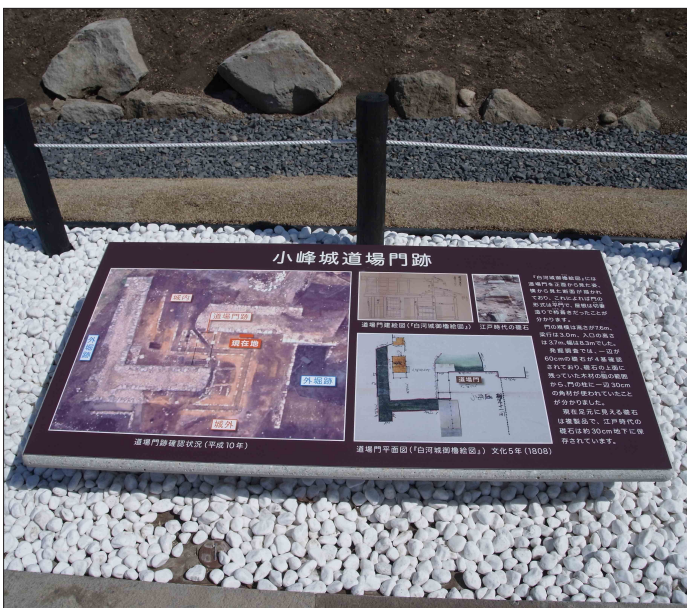
表示板サイズ：W1470×H720mm 表示方法：油性インクジェット印刷＋熱硬化型フッ素系トップコート