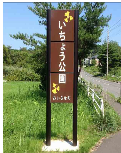
表示板サイズ：W600×H1800mm 表示方法：スーパーカラー R 本体素材：アルミ押出型材