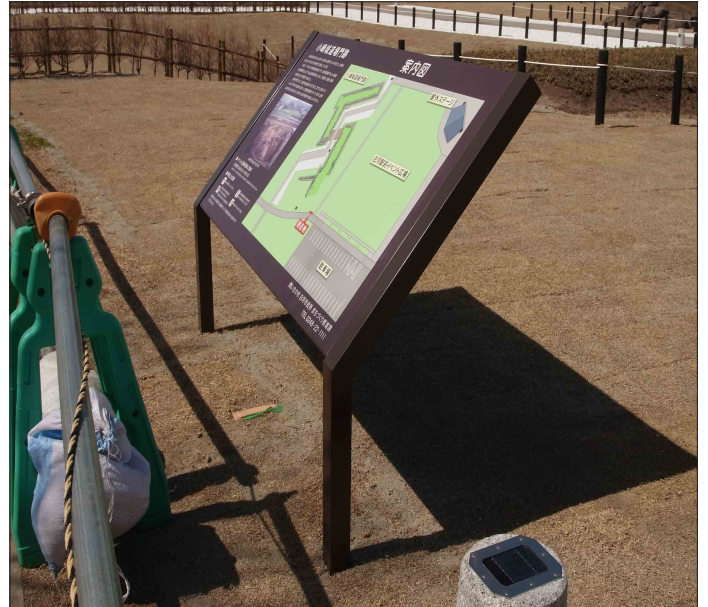
表示板サイズ：W1500×H800mm 表示方法：油性インクジェット印刷＋熱硬化型フッ素系トップコート 本体素材：SUS（焼付塗装）