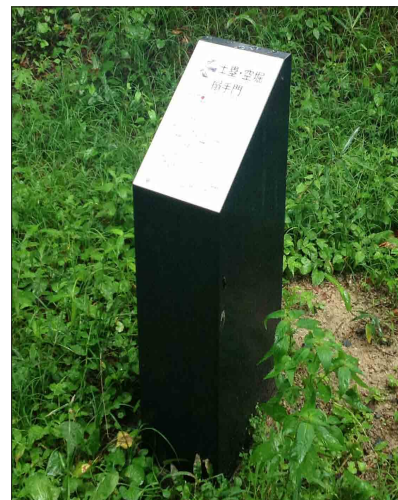
表示板サイズ：W200×H300mm 表示方法：ハイブリッドカラー 本体素材：SUS（焼付塗装）