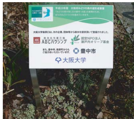
まちのみどりづくりをすすめる小型サイン