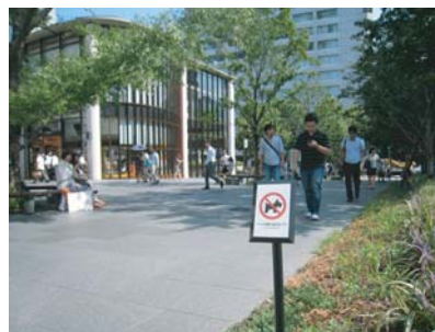
公共敷地内マナーラベル