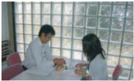
お客さまとの綿密な打合せ