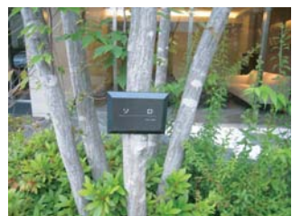
ブランドラベル設置事例