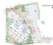
②ラベル配置図作成