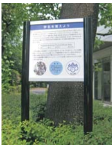
桐朋学園のシンボルである「キリ」の学名について解説したサインを設置