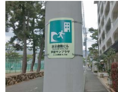
津波避難ビル表示サイン