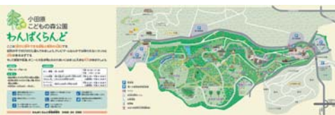
表示レイアウトのご提案