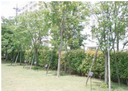
昭和学園新体育館前