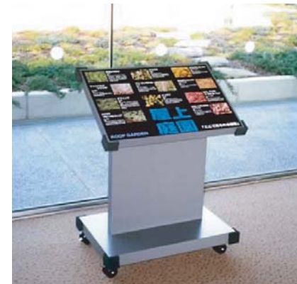
屋上庭園の植物解説サイン