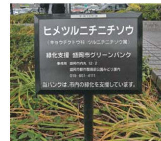
緑化支援のラベル