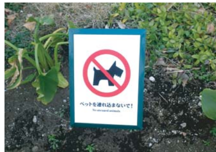
マンション敷地内マナーラベル