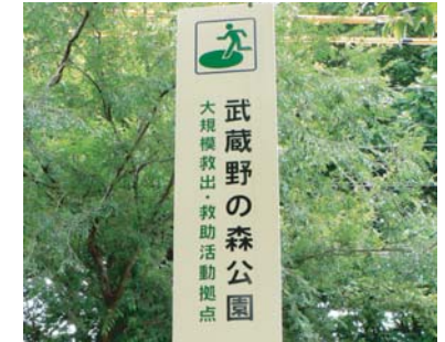
救助活動拠点表示サイン