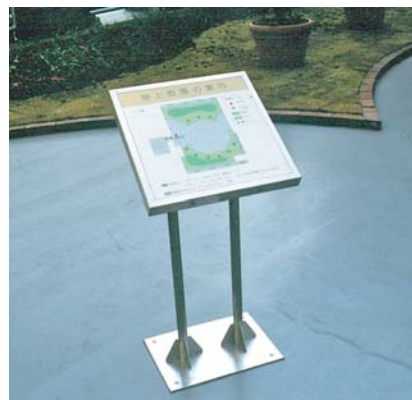
屋上庭園の案内サイン