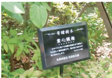
角大 特注レイアウト 製品サイズ：w219×h164 表示面：アポレーザー 再生樹脂ベース