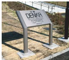
企業の創立記念に