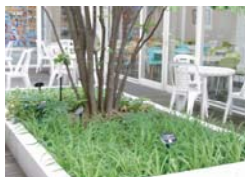
学生食堂「ソフィア」のパティオ

橋岡中 特注レイアウト 製品サイズ：w161×h125 表示面：アポレーザー 再生樹脂ベース