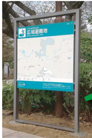
避難地案内サイン