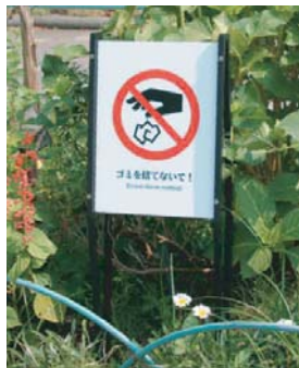
植栽エリアのマナーサイン