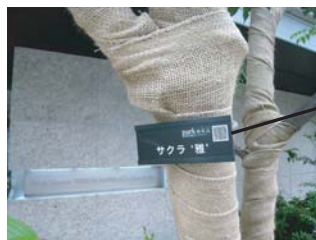
パークホームズラベル設置事例