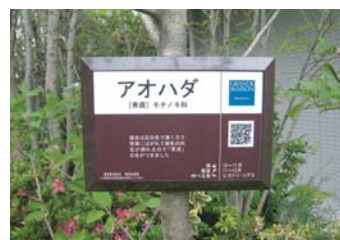
グランドメゾンラベル設置事例